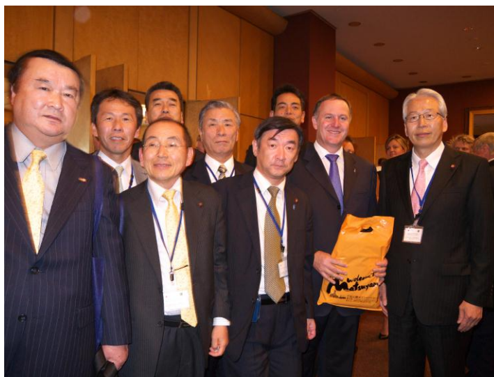
(ジョン・キー首相(右から二人目)を囲んで)