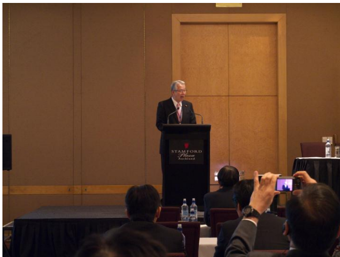
(視察団を代表してスピーチを行う)

この委員会は、両国の経済関係を緊密化し、長期的に発展させることを目的に1974年に設立された会で、日本の主要企業のトップもメンバーに連ねて