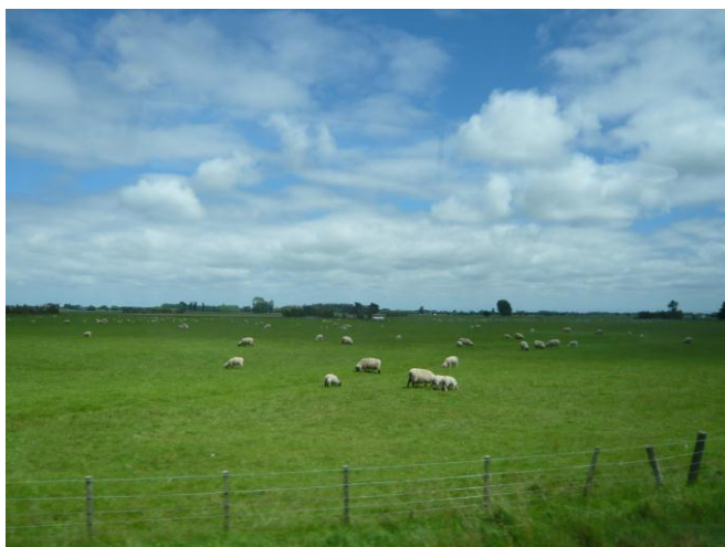
（放牧されている羊）

民族に関しては欧州系（約68%）、先住民マオリ系（約15%）、アジア系（約9%）、ポリネシア系（約7%）となっており、特に近年、韓国人や中国人などアジア系の増加が著しいと言われている。