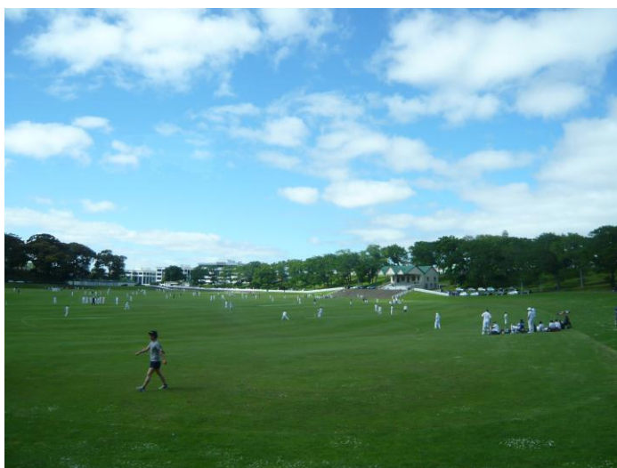
(オークランド・ドメイン内に整備された 芝生グラウンド)

スポーツに関しては、ニュージーランドはラグビー、ヨット、登山など、いずれも世界トップ水準にあり、これらの分野では日本はニュージーランドに遠く及ばない。ラグビーでは、いまやスポーツイベントとして、FIFAワールドカップ、オリンピックに次ぐ世界で第3番目に大きな大会であるともいわれるラグビーワールドカップにおいて、ニュージーランドは第6回大会を除き毎回4位以上の成績を収め、さらに第1回及び最新の第7回大会で優勝している。これは、緑あふれる街・クライストチャーチを代表するハグレー公園の中にもラグビー