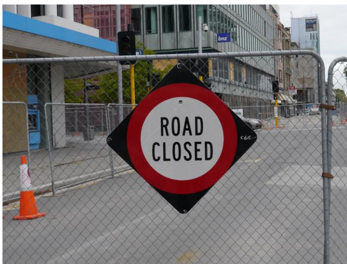
(フェンスにより封鎖されている市中心部)