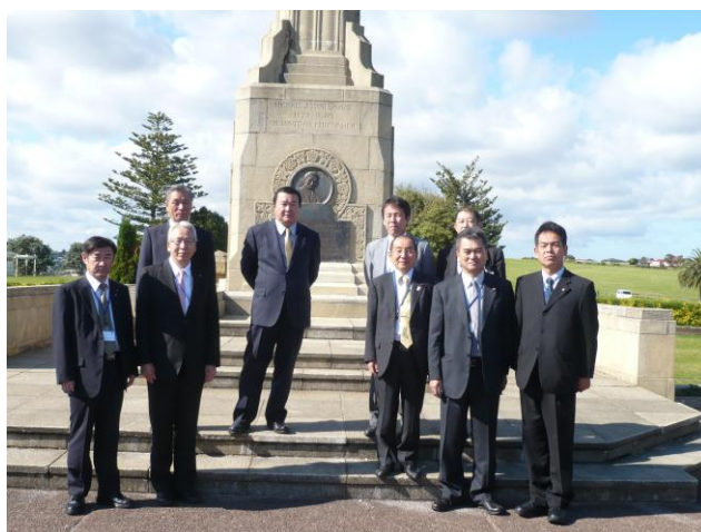
(マイケル・ジョセフ・サヴェージの記念碑の前で)

マイケル・ジョセフ・サヴェージは、1935年に政権を獲得した労働党の党首であり、労働党初の首相である。