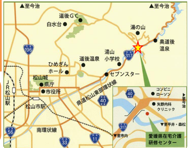
【当センターの周辺図】