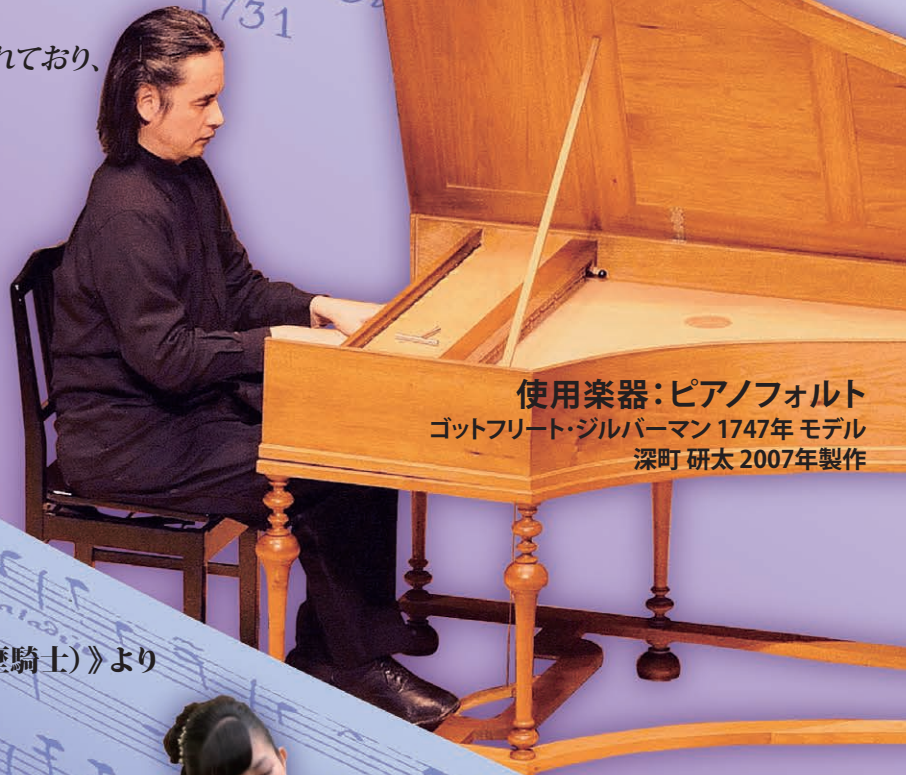
使用楽器：ピアノフォルト ゴットフリート・ジルバーマン 1747年モデル 深町 研太 2007年製作