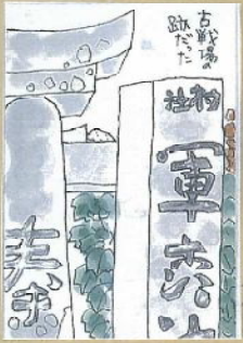
神名石「村社 軍森神社」鳥居「奉」「献」