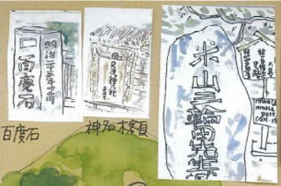
百度石 神名木客員