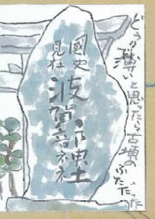
神名石「国史見在 波賀部神社」