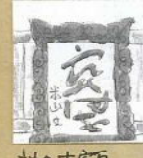
神名木客員「客天満宮」